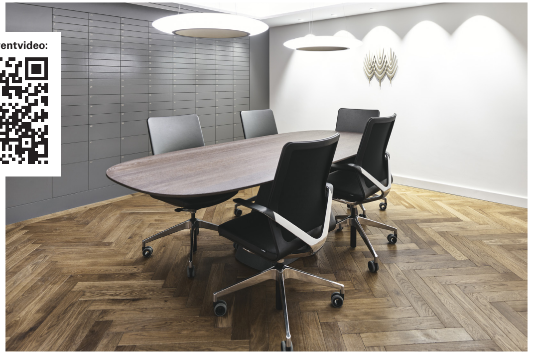
Ein separates Sitzungszimmer sorgt für Diskretion bei Beratungsgesprächen.