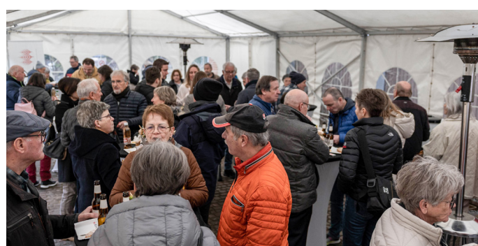
Rund 500 Gäste waren vor Ort: Auf dem Gelände herrschte gute Stimmung.