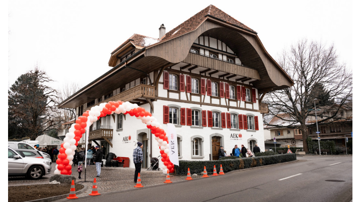
Wiedereröffnung in Steffisburg: Die renovierte Niederlassung am Mühlerweg 11 in Steffisburg lockte zahlreiche Besucher:innen an.