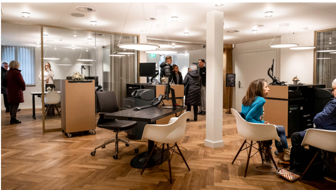
Neue Bankräumlichkeiten: Die Gäste lassen sich von den Mitarbeitenden die neue Niederlassung zeigen.