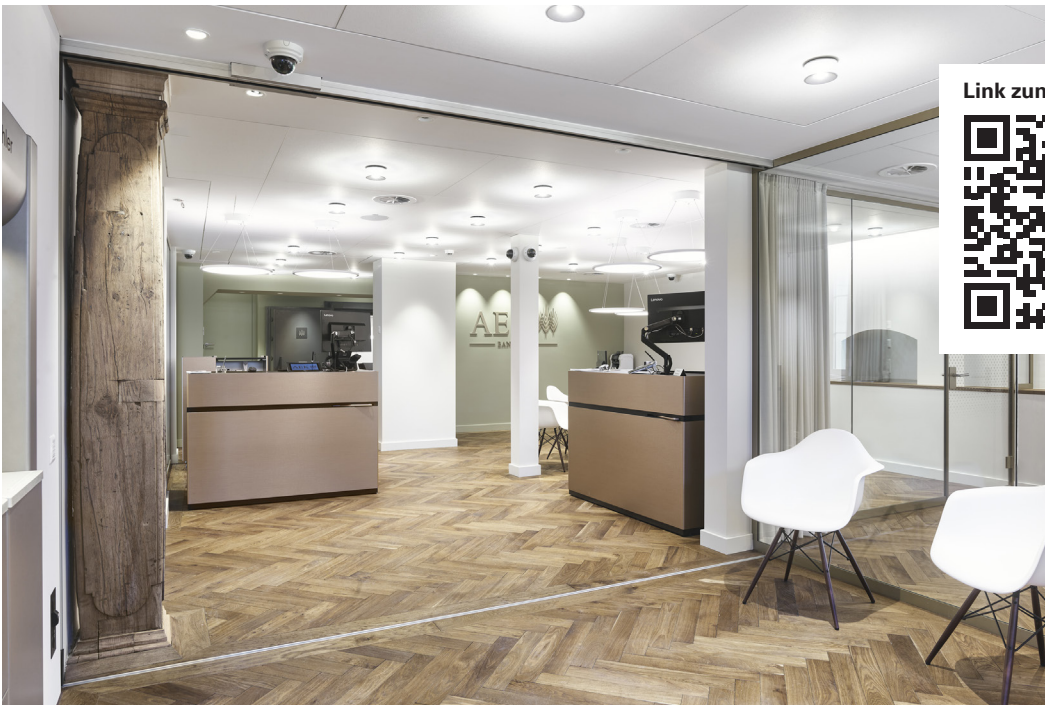
Heller, offener und grosszügiger: So präsentiert sich die Niederlassung Steffisburg nach ihrem Umbau.