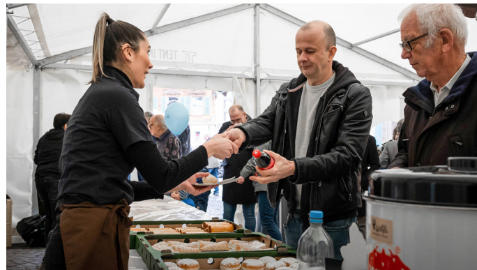
Bratwurst/Chäsbrägel und süsse Überraschung: Auch für das kulinarische Wohl der Besucher:innen wurde gesorgt.